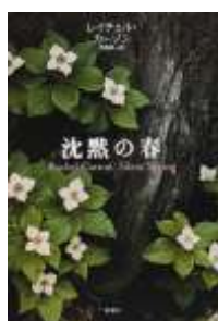
『沈黙の春 新装版』 レイチェル・カーソン著 新潮社、2001年 分類519 登録番号5205