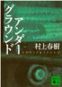
『アンダーグラウンド』 村上春樹著 講談社、1999年 分類913 登録番号111107956