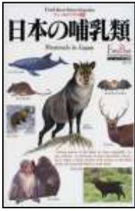
『日本の哺乳類』 小宮輝之著 学習研究社、2002年 分類 489 登録番号 2615