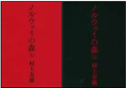
『ノルウェイの森 上・下』 村上春樹著、講談社、2016年 分類913 登録番号130007278、13006079

宇沢弘文『社会的共通資本』。1940年代、東京大学の数学科で学んでいた著者は、終戦後の荒廃した社会を何とかしたいと経済学へと転向します。多くの経済学者や資本主義社会がひたすら利潤を増やすシステムを目指してきた一方で、宇沢は人が幸せになれる経済学は誤っているという信念を貫き続けました。たとえば、農業は地域の文化やコミュニティを支え、自然環境を保全する大事な産業であると主張しています。効率化をめざしがちな現代社会には彼の思想が必要かもしれません。