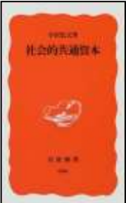
『社会的共通資本』 宇沢弘文著 講談社、2000年 分類343 登録番号1668