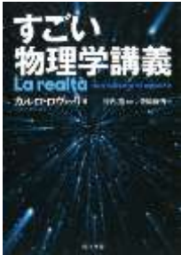
『すごい物理学講義』 カルロ・ロヴェッリ著 河出書房新社、2019年 分類913 登録番号111107956

カルロ・ロヴェッリ『すごい物理学講義』。私は宇宙のことを考えるのが好きです。宇宙がどのようにできているのかを考えると、わくわくします。本書は古代ギリシャの時代から人々がどうやって世界をとらえ、宇宙の不思議を解き明かそうとしてきたのかをわかりやすく解説しています。「わかりやすく」といっても、量子力学のあたりからハードルが高くなってきて、正直に言うと、最後の章はほとんど理解できませんでした。でも、読書は自由なので、面白いと思ったところをパラパラめくるだけでも良いのです。気軽に読書を楽しみましょう。