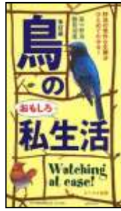
『鳥のおもしろ私生活』 ピッキオ編著 主婦と生活社、2013年 分類 488 登録番号 111108190